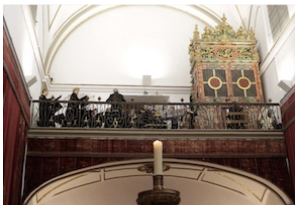
Tribuna del órgano de la capilla de San Jerónimo