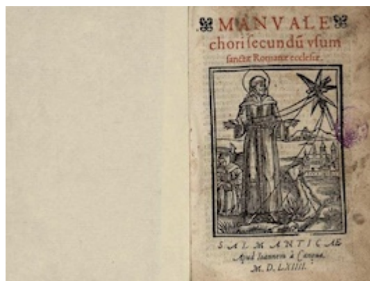
Manuale chori . Salamanca: Juan de Cánova, 1564