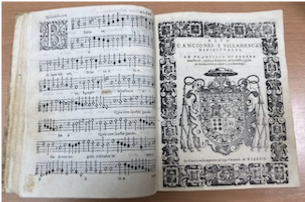
Portada Canciones y villanescas (1589). Francisco Guerrero