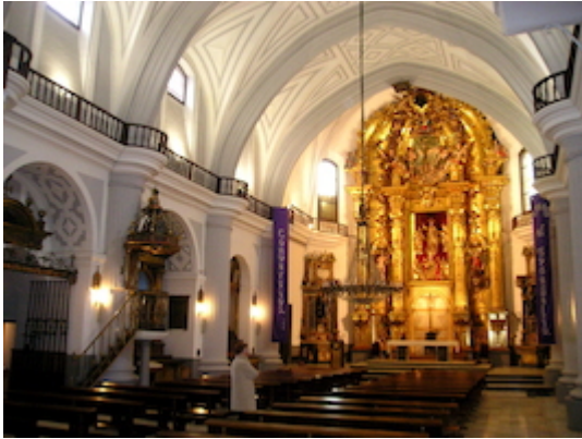
Iglesia de San Salvador (interior)