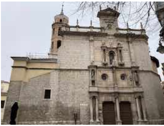
Iglesia de San Salvador. Fotografía de Juan Ruiz Jiménez