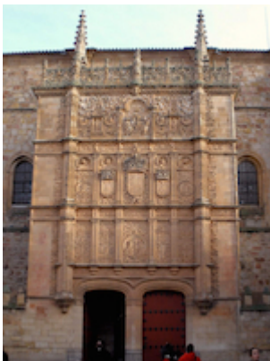
Fachada de la Universidad de Salamanca