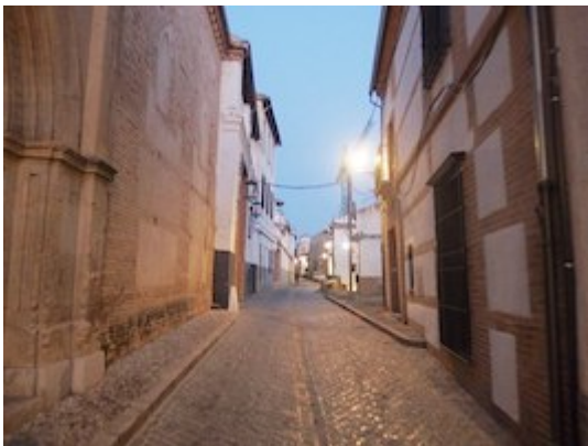
Calle San Juan de los Reyes