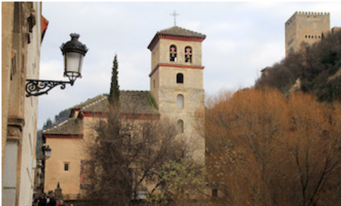
Iglesia de San Pedro y San Pablo