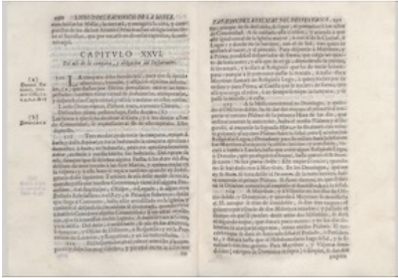
Ceremonial romano seráfico de los menores capuchinos de N. P. S. Francisco, 190-191