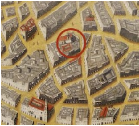
Convento de Nuestra Señora de la Candelaria. Vista Arámburu (Cádiz, c. 1675)