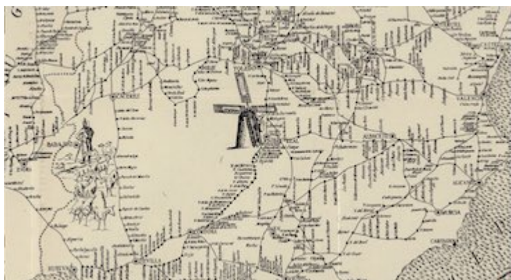
Ruta de Sevilla a Madrid. Reportorio [sic] de todos los caminos de España . Juan Villuga (1546)