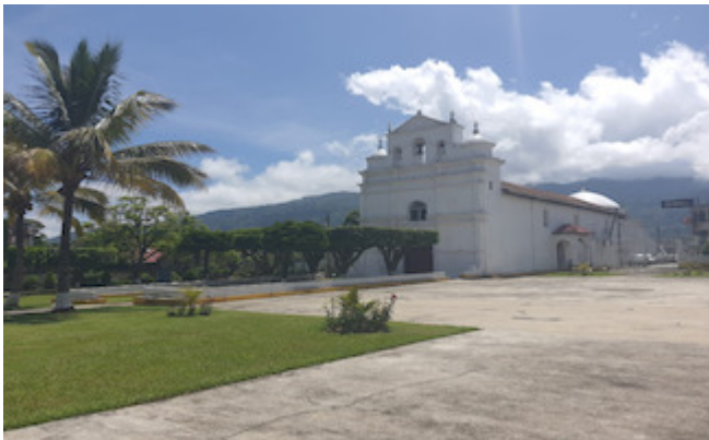
Iglesia de la Purificación de Jacaltenango