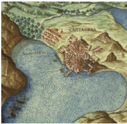
Puerto de Cartagena. La descripción de España y de las costas y puertos de sus reinos , fol. 71r. Pedro Teixeira (1634)