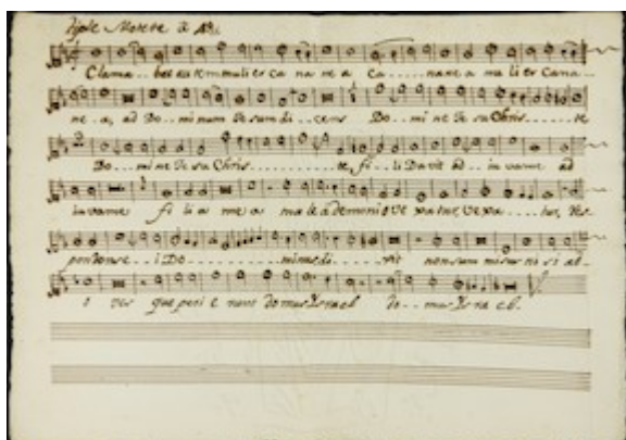
Clamabat autem . Francisco Guerrero [E-Vac leg. 1, pieza 12]

https://www.youtube.com/embed/6Xo-o3RMVQ0?iv_load_policy=3&fs=1&origin=https://www.historicalsoundscapes.com