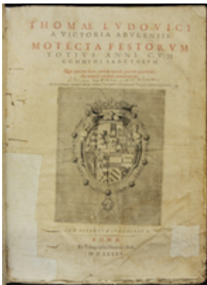
Motecta festorum totius anni . Tomás Luis de Victoria (Roma, 1585)