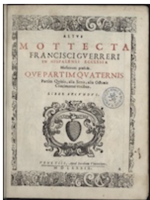
Mottecta... Liber secundus (Venecia: Giacomo Vincenzi, 1589) [G 4875]. Francisco Guerrero