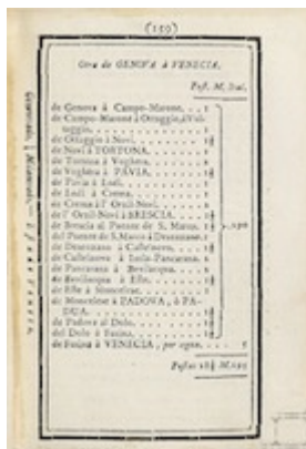
Viaje de Génova a Venecia. Itinerario de las carreras de posta (1761)

https://www.youtube.com/embed/fWMdIX1ABoQ?iv_load_policy=3&fs=1&origin=https://www.historicalsoundscapes.com