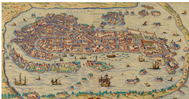
Venetia. Civitatis Orbis Terrarum. G. Braun & F. Hogenberg (c. 1572)