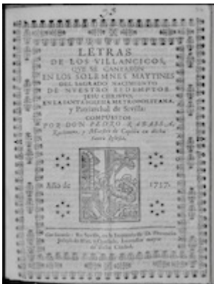
Letras de los villancicos que se cantaron... año 1737