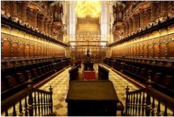
Vista del coro y capilla mayor de la catedral de Sevilla desde la silla arzobispal