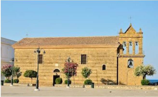
Iglesia de San Nicolás (Agios Nikolaos Molos)