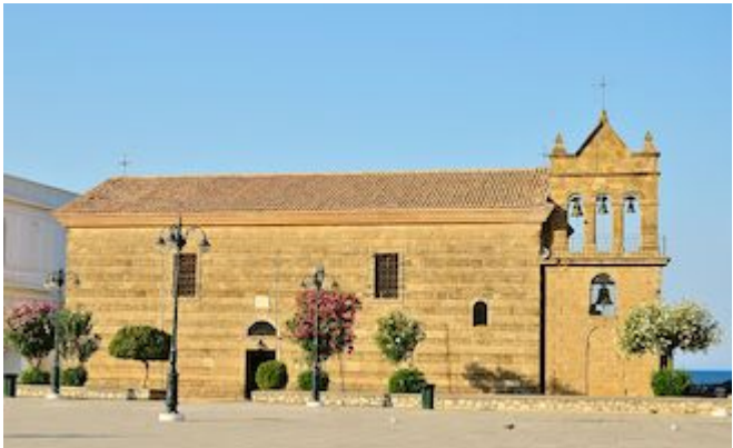
Iglesia de San Nicolás (Agios Nikolaos Molos)