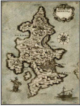
Isla de Zante. Donato Bertelli (c. 1574)