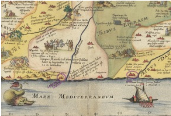
Descriptio Et Situs Terrae Sanctae Alio Nomine Palestina . Sebastian Münster (1593)