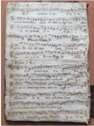
Contraducem superbiae [Francisco Guerrero] [GCA-Gc Ms. 3, fol. 5v]