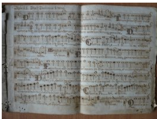
Dixit Dominus . 1º Tono. [Francisco Guerrero] [GCA-Gc Papeles de Música 451]