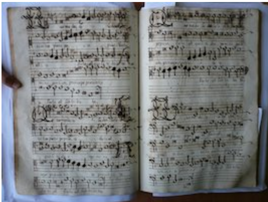
Quomodo sedet sola. Francisco Guerrero [GCA-Gc Ms. 4, fols. 80v-81r]