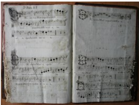
Dic nobis Maria [Francisco] Guerrero [GCA-Gc Ms. 1, fols. 191v-192r]