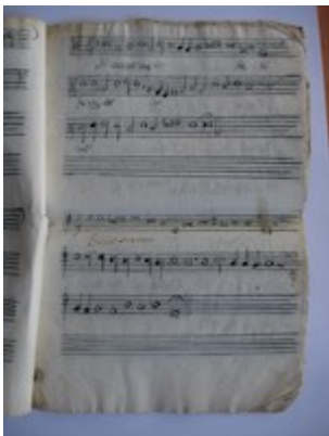
Sicut cervus. [Francisco Guerrero] [GCA-Gc Ms. 6, s.f.]