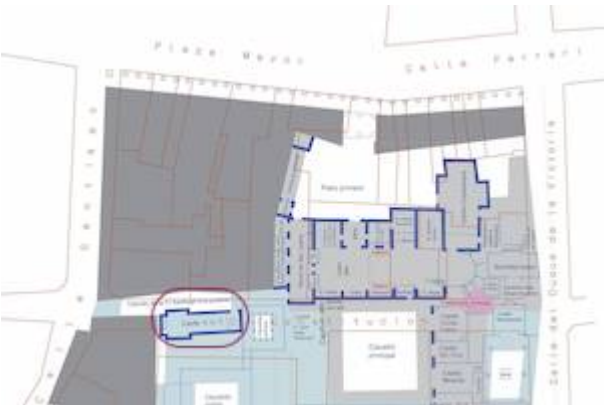
Capilla Orden Tercera. Parte norte del convento de San Francisco de Valladolid según hipótesis de Sáiz Virumbrales y Castro Sánchez (2021)

Referenciar: Ruiz Jiménez, Juan. "Órgano para la capilla de la Venerable Orden Tercera del convento de San Francisco de Valladolid (1712)", Paisajes sonoros históricos , 2024. e-ISSN: 2603-686X. https://www.historicalsoundscapes.com/evento/1609/valladolid .