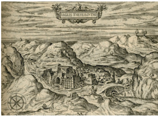
Vallis Therebinthi. Jean Zuallart (1587)