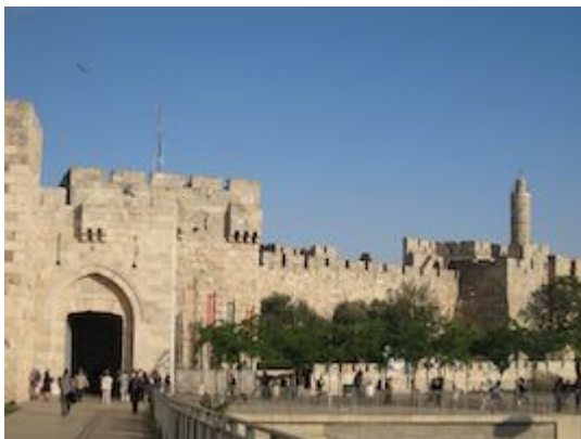
Vista de la puerta de Jaffa y de la Torre de David