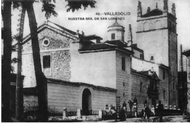
Iglesia de San Lorenzo