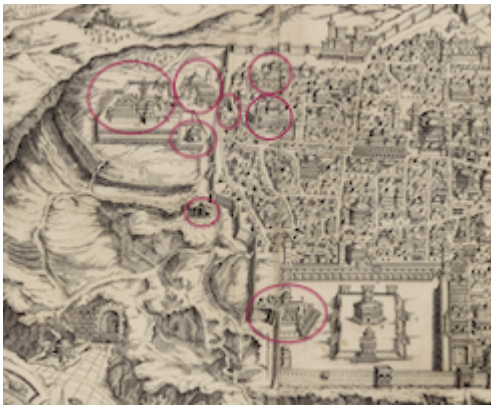
Estaciones en barrio armenio y monte Sión. Mapa de Jerusalén. Fray Antonino de Angelis (1578)