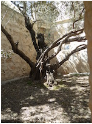
Olivo del patio de la iglesia de los Santos Arcángeles