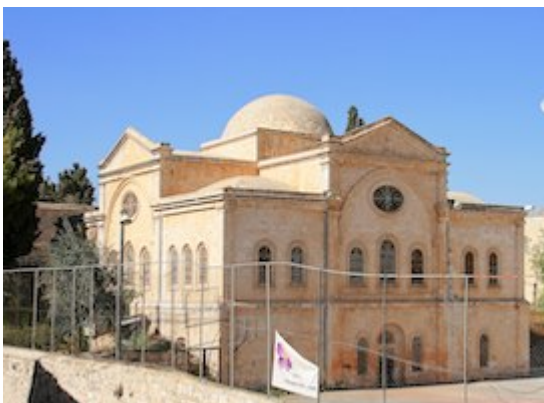
Iglesia de los Santos Arcángeles (armenia)