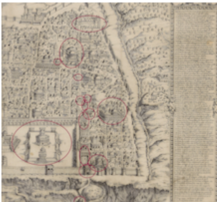
Estaciones en la Vía Dolorosa. Mapa de Jerusalén. Fray Antonino de Angelis (1578)