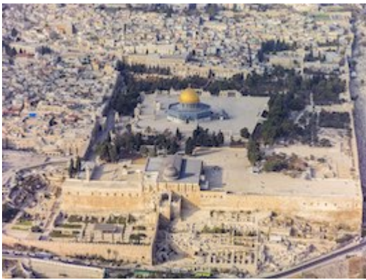
Monte del Templo