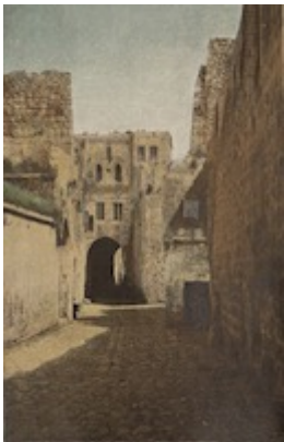
Casa de Epulón