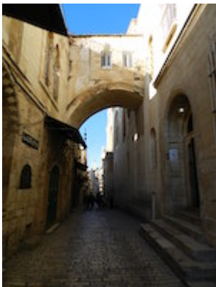
Arco del Ecce Homo