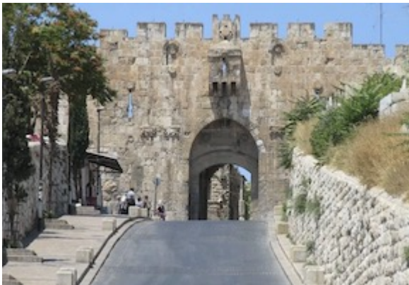
Puerta de San Esteban (= de los Leones)