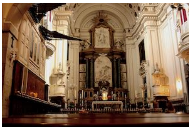
Iglesia del monasterio de las Descalzas Reales