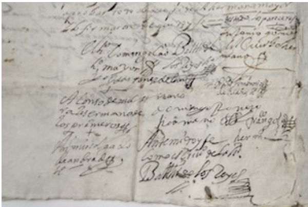
Firma de los cofrades. Archivo Histórico Diocesano de Granada, Caja 108F, pieza 46