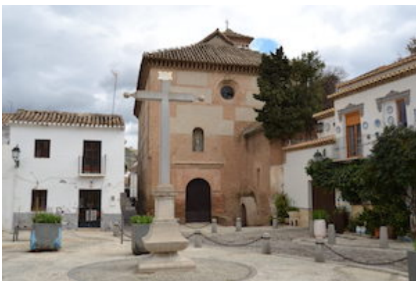
Plaza de San Bartolomé