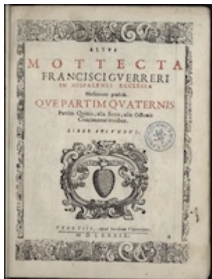
Mottecta... Liber secundus (Venecia: Giacomo Vincenzi, 1589) [G 4875]. Francisco Guerrero