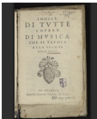
Indice di tutte l'opere di musica che si troua alla stampa della Pigna (Venecia: Giacomo Vincenzi, 1591)