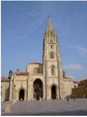
Catedral de Oviedo