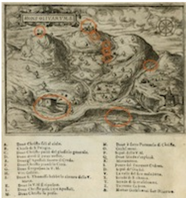
Mons Olivarums. Il devotissimo viaggio di Gerusalemme . Jean Zuallart (1587), p. 152