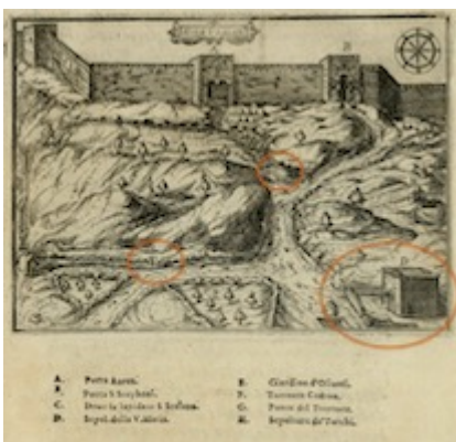
Hierusalem. Il devotissimo viaggio di Gerusalemme . Jean Zuallart (1587), p. 159