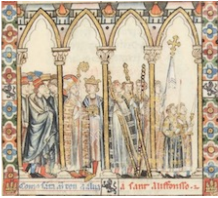
Procesión real. Cantiga nº 2. Códice rico, fol. 7r