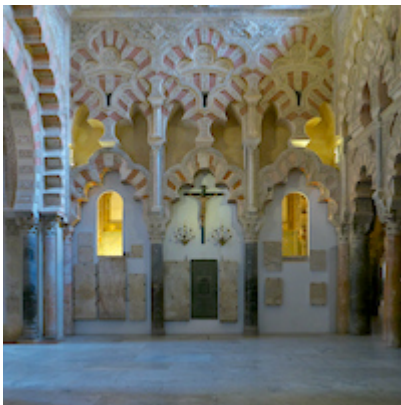
Capilla de Villaviciosa