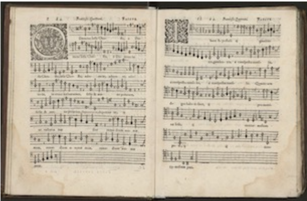
"Domine Iesu Christe" / "Ibant apostoli". Francisco Guerrero. Sacrarum symphoniarum (1600)