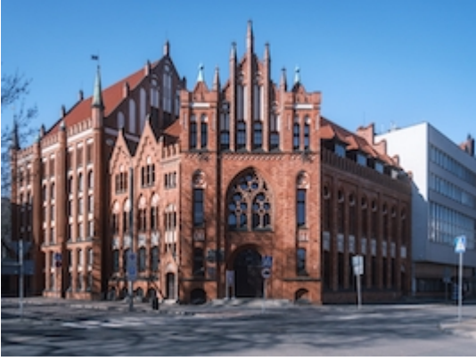
Biblioteca de la Academia Polaca de Ciencias