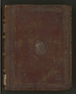
Librete del Altus. Sacrarum symphoniarum (1600)