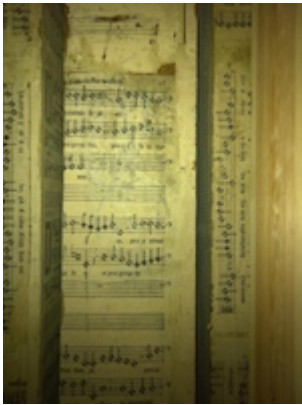
Tubo de madera del órgano de la Catedral de Cuenca forrado con hojas de libro de T.L. de Victoria

"http://www.youtube.com/embed/FWhRrFypTg?iv_load_policy=3&fs=1&origin=http://www.historicalsoundscapes.com"