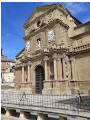
Catedral de Calahorra.