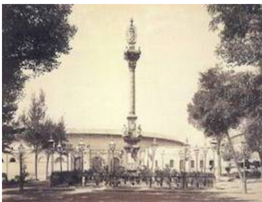
Triunfo de la Inmaculada y plaza de toros en su primitiva localización