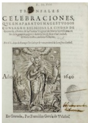
Triunfales celebraciones (1640)