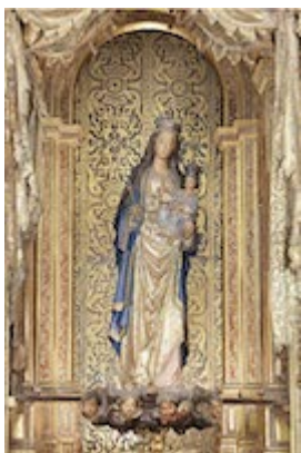
Nuestra Señora de la Antigua