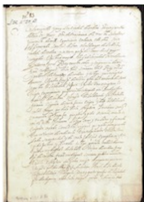
Escrituras de traspaso de la capilla llamada del Espíritu Santo de la catedral de Córdoba (1496)