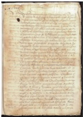
Escrituras de donación de la capilla llamada del Espíritu Santo de la catedral de Córdoba (1369)