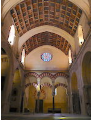
Espacio de la antigua capilla del Espíritu Santo