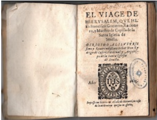
Viage de Hierusalem. Francisco Guerrero (Alcalá de Henares: Juan Gracián, 1605)