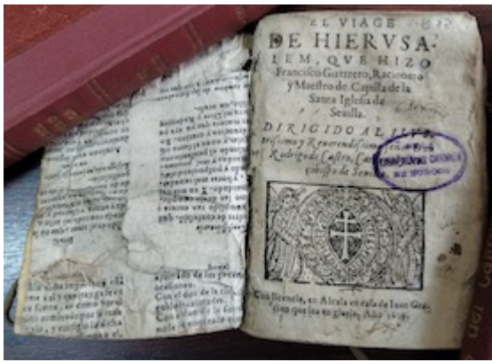
Portada. El viage de Hierusalem . Francisco Guerrero (Alcalá de Henares: Juan Gracián, 1609)