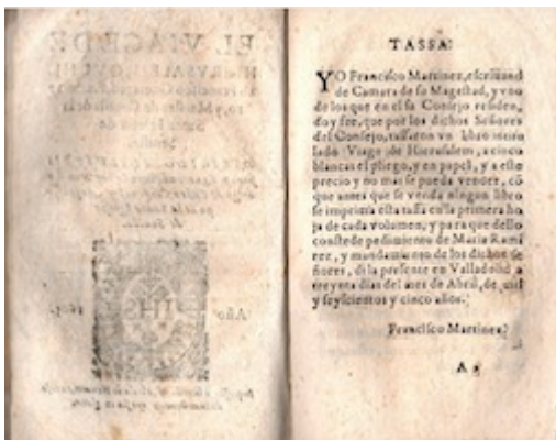
Tasa. El viage de Hierusalem . Francisco Guerrero (Alcalá de Henares: Juan Gracián, 1605)