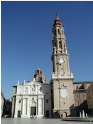
Catedral de Zaragoza.