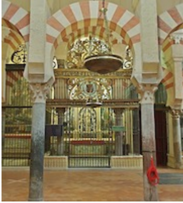
Antigua localización de la capilla de Santa María Magdalena