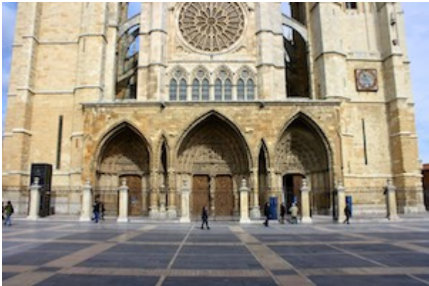
Fachada de la catedral de León