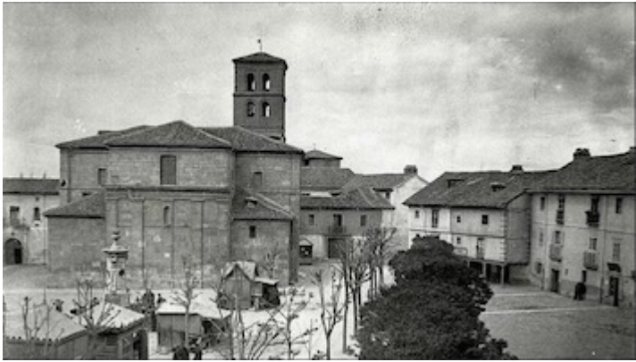
Iglesia de San Marcelo