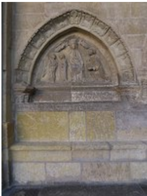
Nuestra Señora del Foro y Oferta de Regla. Claostro de la catedral de León