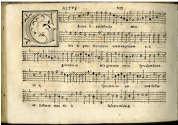
Altus. Gloriose confessor Domini. Sacrae cantiones quae vulgo moteta nuncupatur (1555). Francisco Guerrero