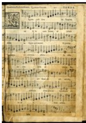
Tenor. Regina celi. Motteta (1570). Francisco Guerrero

https://www.youtube.com/embed/YwTGH7KgN58?iv_load_policy=3&fs=1&origin=https://www.historicalsoundscapes.com