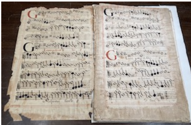
"Gloria Patri". [ Magnificat. Primi toni ]. Francisco Guerrero