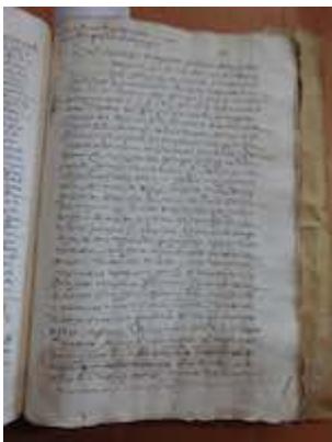
Contrato para la construcción del órgano de la iglesia de San Eutropio (Segovia)