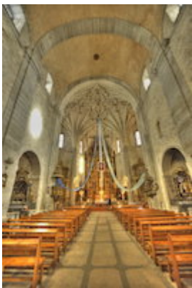
Iglesia de San Eutropio. El Espinar (Segovia)