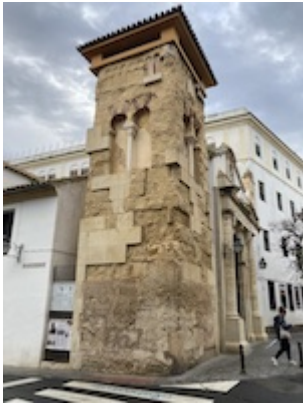
Iglesia de San Juan de los Caballeros.