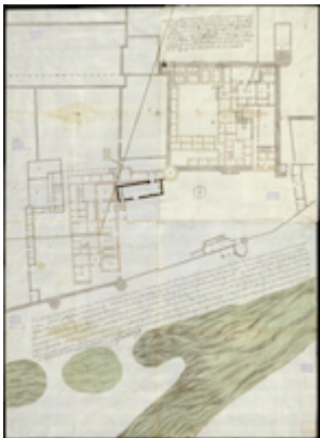
Plano del Alcázar de Córdoba (1668)