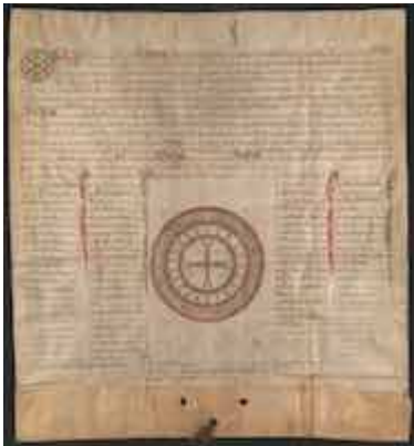
Privilegio de Alfonso X a la Universidad de clérigos de Córdoba (1279)