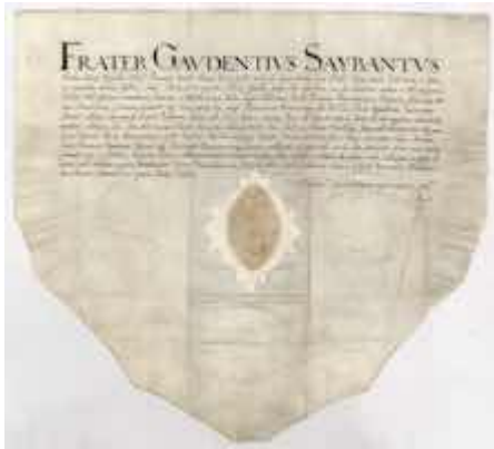
Certificado del peregrino Lukas Friedrich Behaim dado por el custodio Gaudenzio Saibanti (1611).

https://www.youtube.com/embed/k_V7Kb7W1tc?iv_load_policy=3&fs=1&origin=https://www.historicalsoundscapes.com