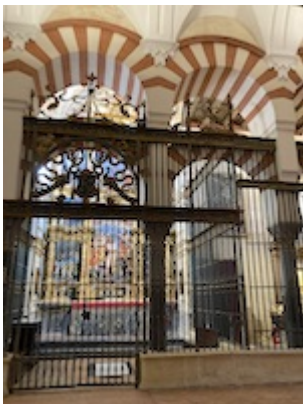
Capilla de San Juan Bautista. Catedral de Córdoba.