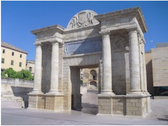
Puerta del Puente