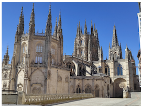
Catedral de Burgos.