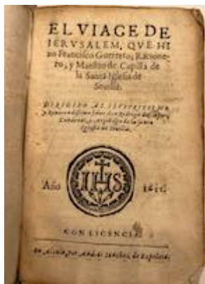
El viage de Hierusalem. Francisco Guerrero (Alcalá de Henares, 1611)