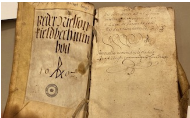
El viaje de Hierusalem . Francisco Guerrero (Sevilla, 1596)