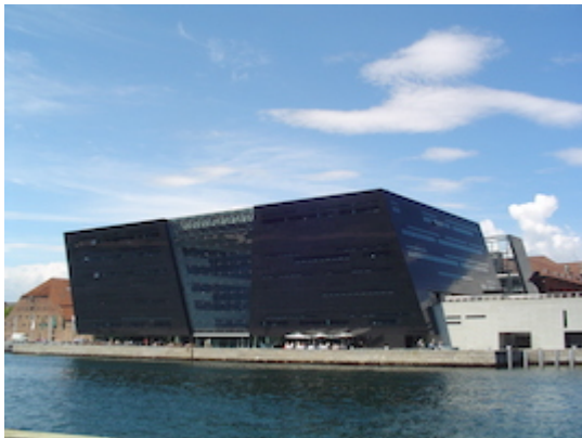
Biblioteca Real de Dinamarca (Det Kongelige Bibliotek)