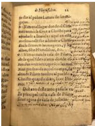
El viaje de Hierusalem . Francisco Guerrero (Sevilla, 1596), fol. 32r