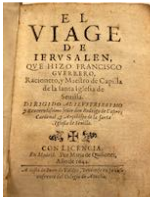
El viaje de Ierusalén. Francisco Guerrero (Madrid, 1644)