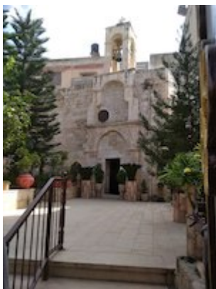
Iglesia de San Jorge en Burqin