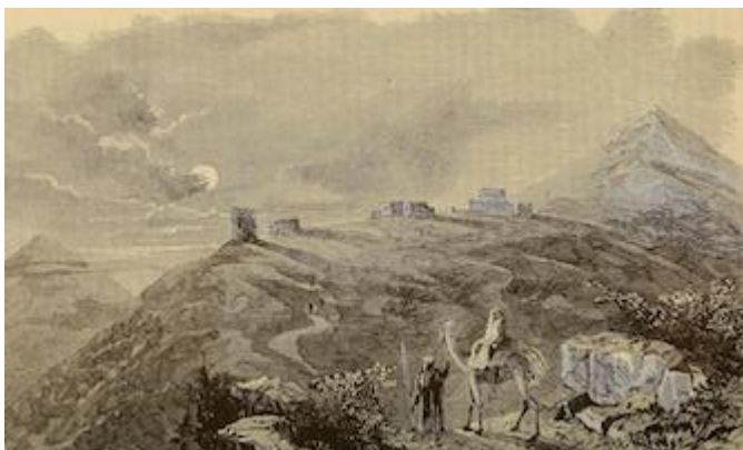
Náin. El pequeño Hermón a la derecha (1887)