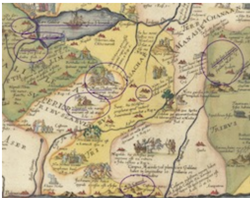
De Samaria a Betsaida. Descriptio et situs Terrae Sanctae alio nomine Palestina multis preclaris historys et miraculis utriusque testamenti a Christo Salvatore nobilitata (1593)