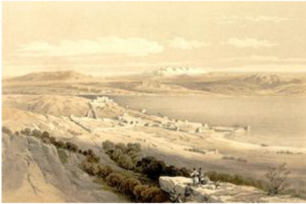
El lago Tiberiades, mirando hacia Hermon. David Roberts (1855)