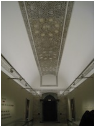
Santa María la Real de Las Huelgas (Burgos). Locutorio visto hacia el oeste.