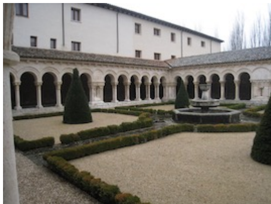
Santa María la Real de Las Huelgas (Burgos). Claustillas.

Planta general de Santa María la Real de Las Huelgas (Burgos) (Corpus de Arquitectura Monástica Medieval UAM, 1998). Clave topográfica: 1. Claustillas; 2. Claustro de san Fernando; 3. Capilla de la Asunción; 4. Capilla de Santiago; 5. Locutorio; 6. Paso a la carrera de Santiago; 7. Carrera de Santiago