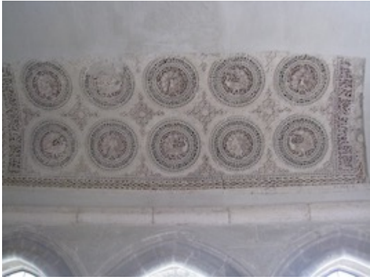
Santa María la Real de Las Huelgas (Burgos). Claustro de san Fernando, yasería de los pavos reales.