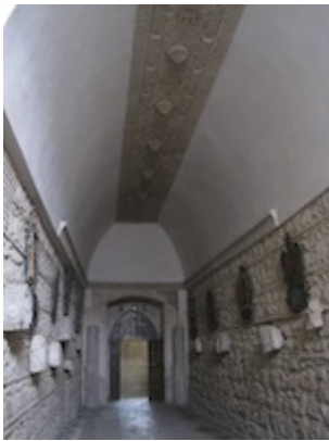
Santa María la Real de Las Huelgas (Burgos). Paso a la carrera de Santiago visto hacia el oeste.