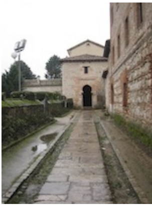
Santa María la Real de Las Huelgas (Burgos). Carrera de Santiago y capilla de Santiago.