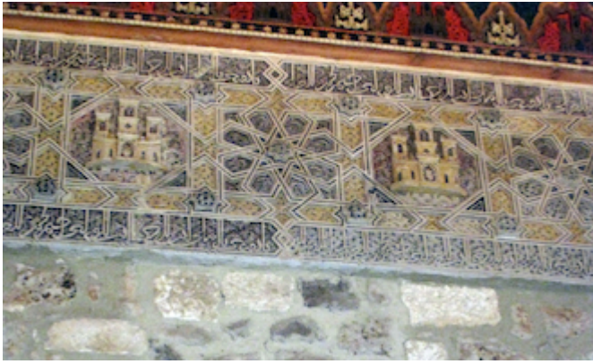
Santa María la Real de Las Huelgas (Burgos). Capilla de Santiago. Detalle del friso bajo el arcoabe.

"https://embed.spotify.com/?uri=https://open.spotify.com/intl-es/track/0rOGxzS1tNDpPuXpS2dqAg?si=572f0f642f664078"