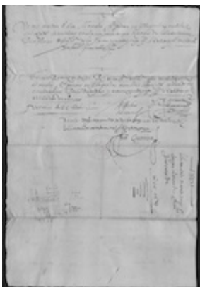
Libramiento de fábrica de 18-9-1587, vuelta.