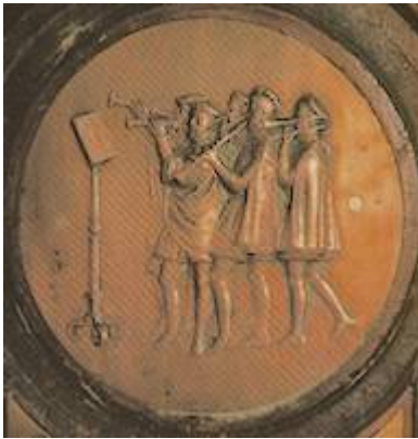
Facistol del coro de la catedral de Sevilla (detalle). Bartolomé Morel (1565)