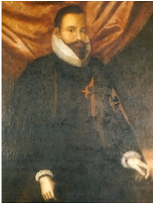
Blasco Núñez Vela. Anónimo