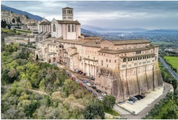
Basílica de San Francisco de Asís