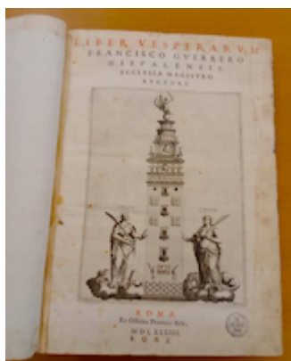
Portada. Liber vesperarum (Roma 1584). Francisco Guerrero.

"https://embed.spotify.com/?uri=https://open.spotify.com/intl-es/track/58YiDOUc29rvH4GnZnbHEw?si=27eb5ef109df471b